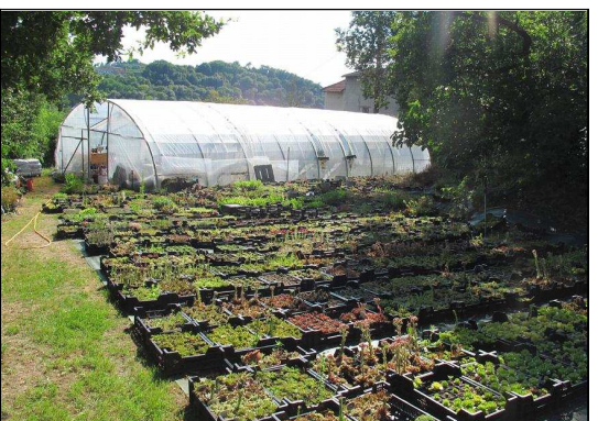
Franck Poly compte deux serres et 1500m 2 de terrain consacrés à ses plantes.

Franck Poly, Sempervivum & Cie ; http://www.sempervivum-et-cie.com/ ; 06 11 39 36 43